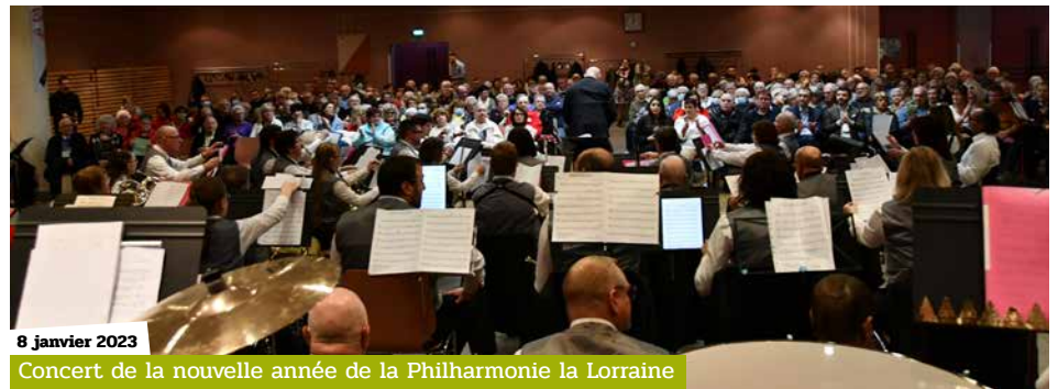
8 janvier 2023 Concert de la nouvelle année de la Philharmonie la Lorraine