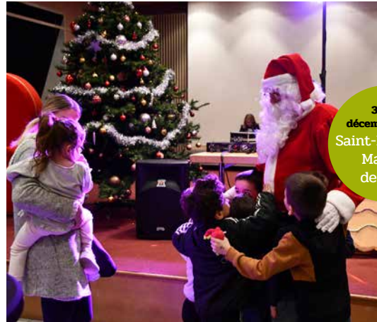
3 et 4 décembre 2022 Saint-Nicolas + Marché de Noël