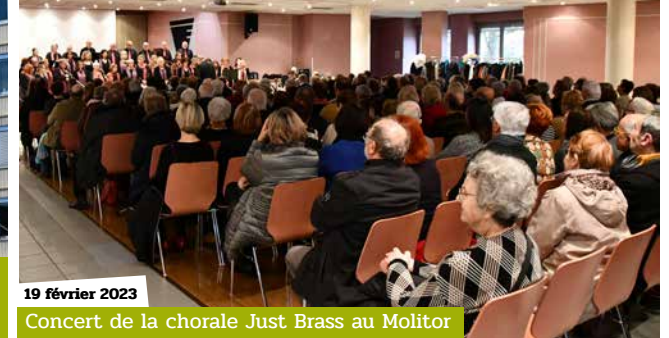
19 février 2023 Concert de la chorale Just Brass au Molitor