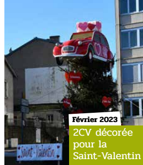
Février 2023 2CV décorée pour la Saint-Valentin