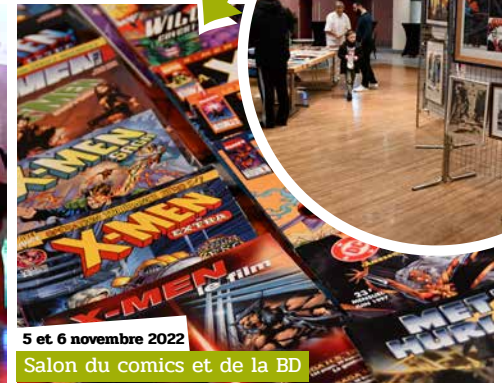
5 et 6 novembre 2022 Salon du comics et de la BD