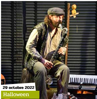
29 octobre 2022 Halloween