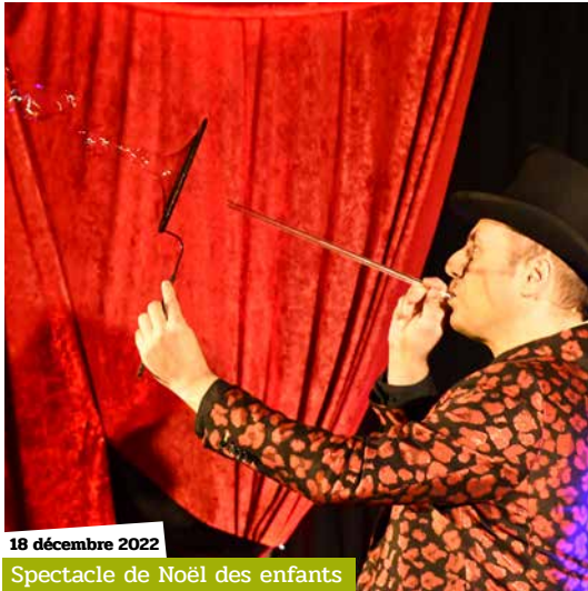
18 décembre 2022 Spectacle de Noël des enfants