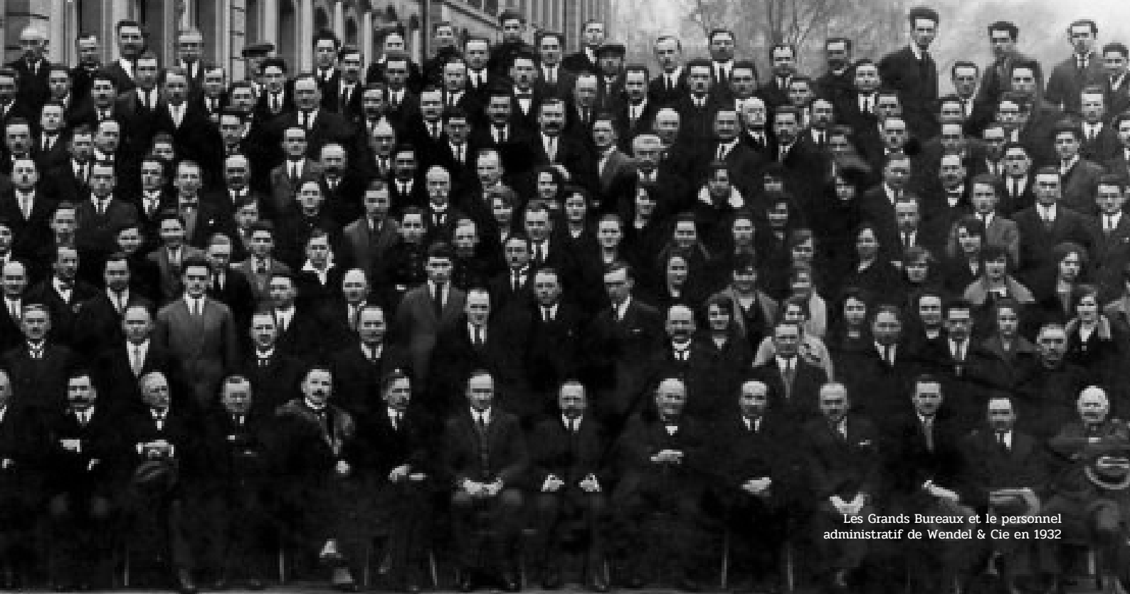
Les Grands Bureaux et le personnel administratif de Wendel & Cie en 1932

Après quarante années d'abandon, les Grands Bureaux de Wendel viennent d'être rachetés par une société immobilière spécialisée dans la restauration du patrimoine architectural historique afin d'être transformés en logements et ouverts au public.