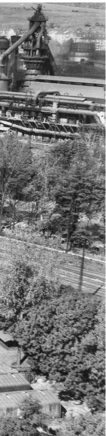
Les Grands Bureaux de Wendel avec l'Orangerie au premier plan et les hauts-fourneaux du Patural au second.

En 1892, la cathédrale d'acier qui s'élève sur le site du Patural aujourd'hui n'existait pas encore, mais les hauts-fourneaux dresseront leurs grandes cheminées dans le ciel hayangeois dès 1898 et la société Wendel & Cie deviendra l'un des premiers producteurs français d'acier après le rattachement de la Lorraine à la France en 1918. Wendel & Cie est alors à son apogée, le site de Hayange l'un des fleurons de la société et les Grands Bureaux fourmillaient d'une activité administrative essentielle au bon fonctionnement de la société. Chacun sait ce qui adviendra par la suite de la grande épopée sidérurgique des Wendel à Hayange jusqu'au sacrifice définitif de 2012 sur l'autel de la mondialisation par le sinistre Lakshmi Mittal avec ArcelorMittal, véritable fossoyeur de l'emploi et de la sidérurgie locale.