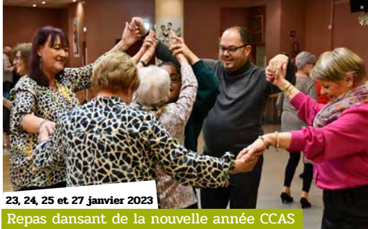
23, 24, 25 et 27 janvier 2023 Repas dansant de la nouvelle année CCAS