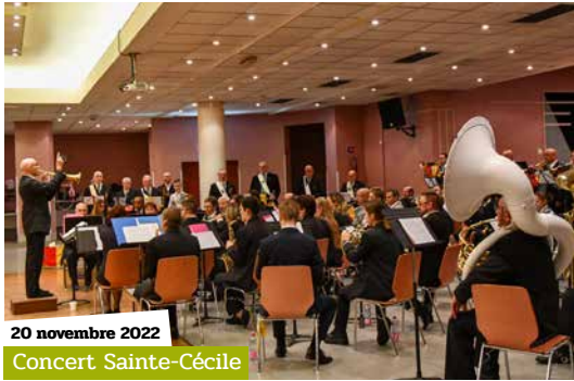
20 novembre 2022 Concert Sainte-Cécile