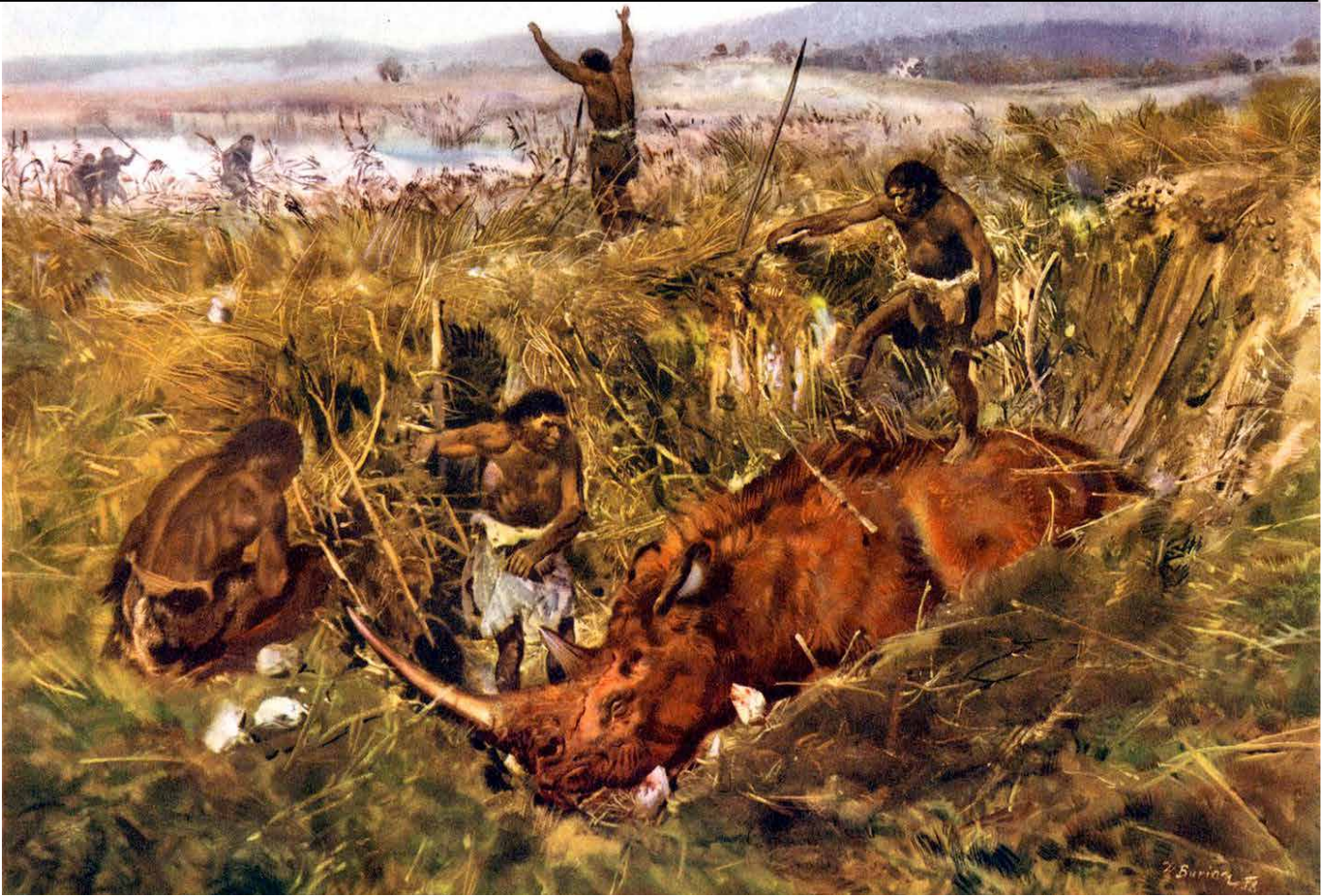
Scène de dépeçage d'un rhinocéros laineux par Zdenek Burian, 1958.

Comme le lion des cavernes, le rhinocéros laineux était à son apogée dans notre région il y a 30 000 ans. Devant la dangerosité de l'animal, le rhinocéros laineux n'était pas une source de nourriture récurrente pour les chasseurs néandertaliens de la vallée de la Fensch, mais il n'était pas rare qu'ils s'attaquent aux membres les plus faibles du troupeau pour les mettre à leur menu.