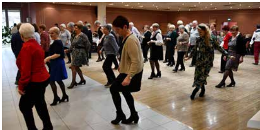
10,11,12 janvier 2023 Vœux du maire